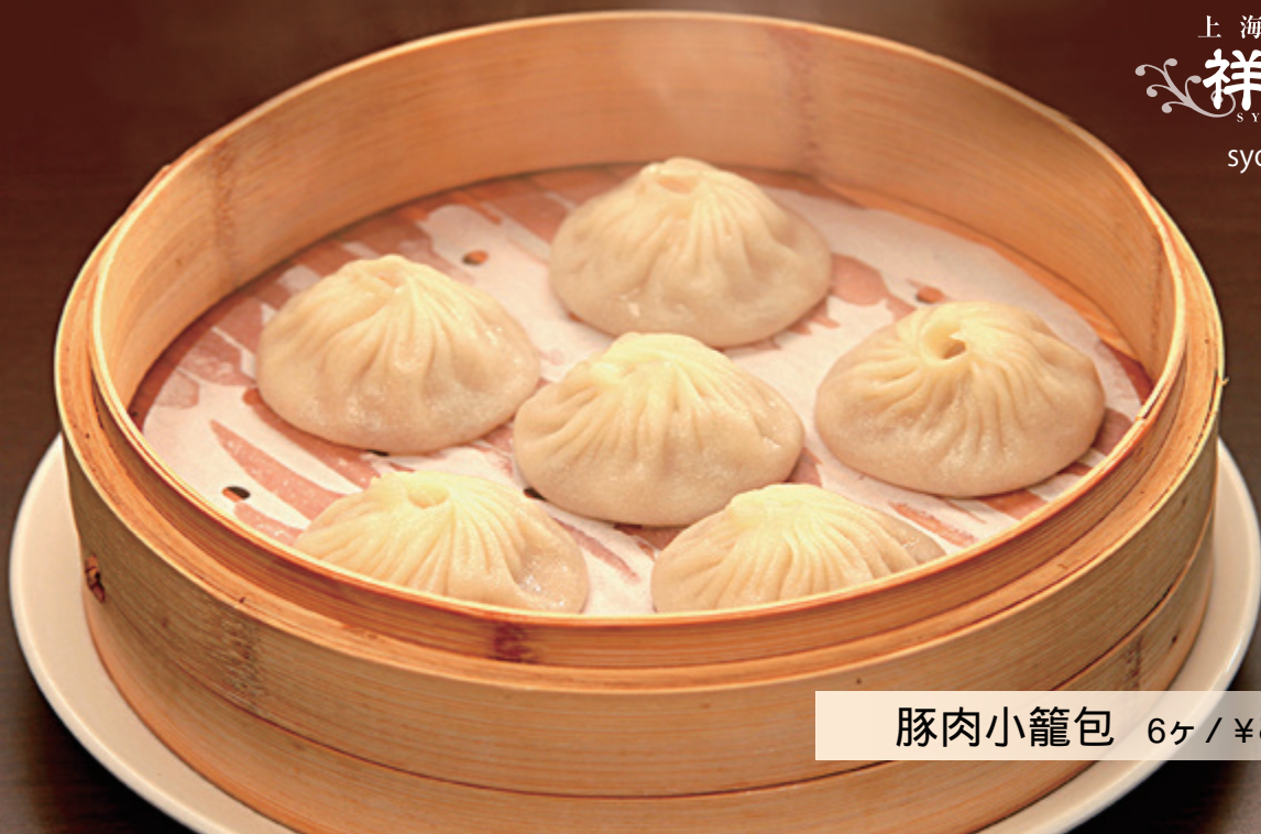
豚肉小籠包 6ヶ / ¥850