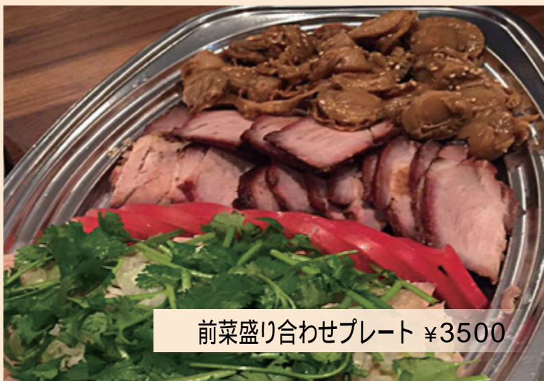
前菜盛り合わせプレート ¥3500